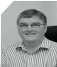
جيريمي فوكس تي أيه تي أي ش م م فبراير ٢٠١٣

قد بأمان. حياتك و حياة عائلتك تعتمد عليها..