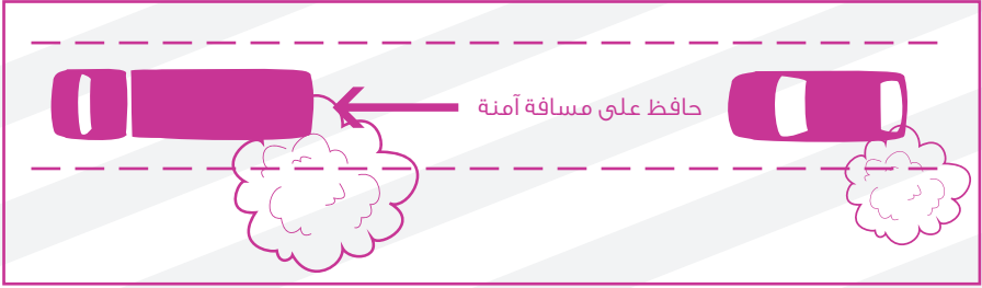
رسم يوضح القيادة في نفس مسار المركبة المثيرة للغبار